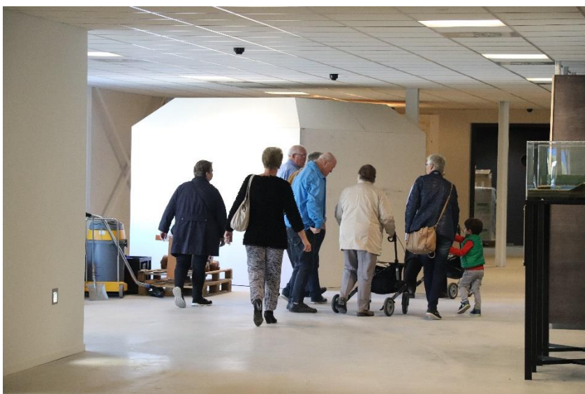
Bezoekers tijdens de burendag.

En een dag later, op 13 december, hield de algemene afdeling van de gemeente haar eindejaarsreceptie in het MuzeeAquarium, waar 125 bezoekers zijn geweest.