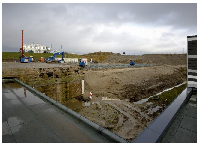
Werkzaamheden aan de dijk.

Met man en macht werd in de tweede helft van 2017 gewerkt aan de nieuwe inrichting. Ondertussen bleef de fondsenwerving achter bij de ambities en begon de tijd te dringen: opdrachten moesten verstrekt worden, maar er was onvoldoende liquiditeit. Gelukkig bood de gemeente in november een oplossing in de vorm van een extra eenmalige subsidie van 3 ton, waardoor de plannen verder gestalte konden krijgen.