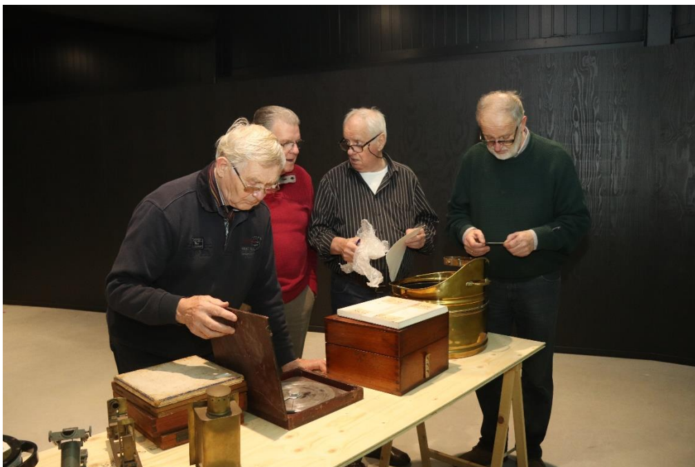
Selectie van voorwerpen voor de nieuwe opstelling.

In 2018 zal ook een collectiebeleid worden opgesteld, waarin het verzamelbeleid zal worden toegelicht. Het MuzeeAquarium beschikt nog niet over een aankoopfonds en een vastgesteld aankoopbeleid, ook dat zal in de loop van 2018 vorm krijgen.